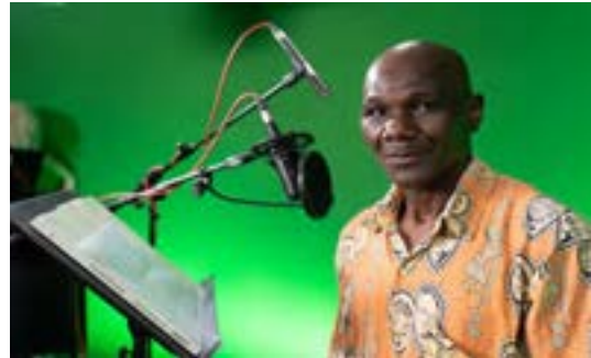
Production of the "Perspectives" (basic exhibition)