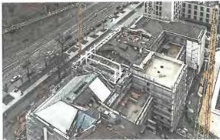
Baustelle für das Forum Wissen mit dem direkt angeschlossenen Thomas-Oppermann-Kultur-Forum im Nordtügel.

Aus dem Etat „Kultur“ erhält Göttingen für das Kultur-Forum bis 2024 bereits insgesamt 9,9 Millionen Euro. Dies hatte der Haushaltsausschuss des Bundestages am Donnerstag beschlossen. Gleichzeitig hatte die Universität verkündet, dass sie das Kultur-Forum künftig „Thomas-Oppermann-Kultur-Forum Göttingen“ nennen wolle. Beide Entscheidungen waren von Vertretern verschiedener Parteien ausdrücklich begrüßt worden.