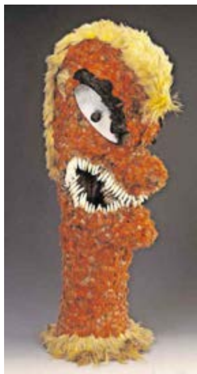
Der Federkopf des Kriegsgottes Kuka'ilimoku ist Teil der Cook/Forster-Sammlung der Ethnologie.