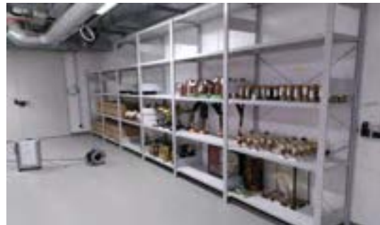
Object preparation room in the FORUM WISSEN