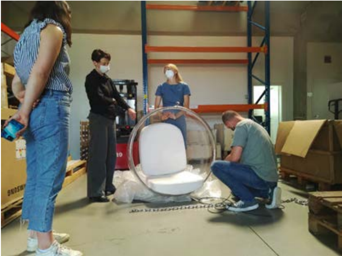
Hardware tests at InSynergie: Bubble Chair and Collection Wall