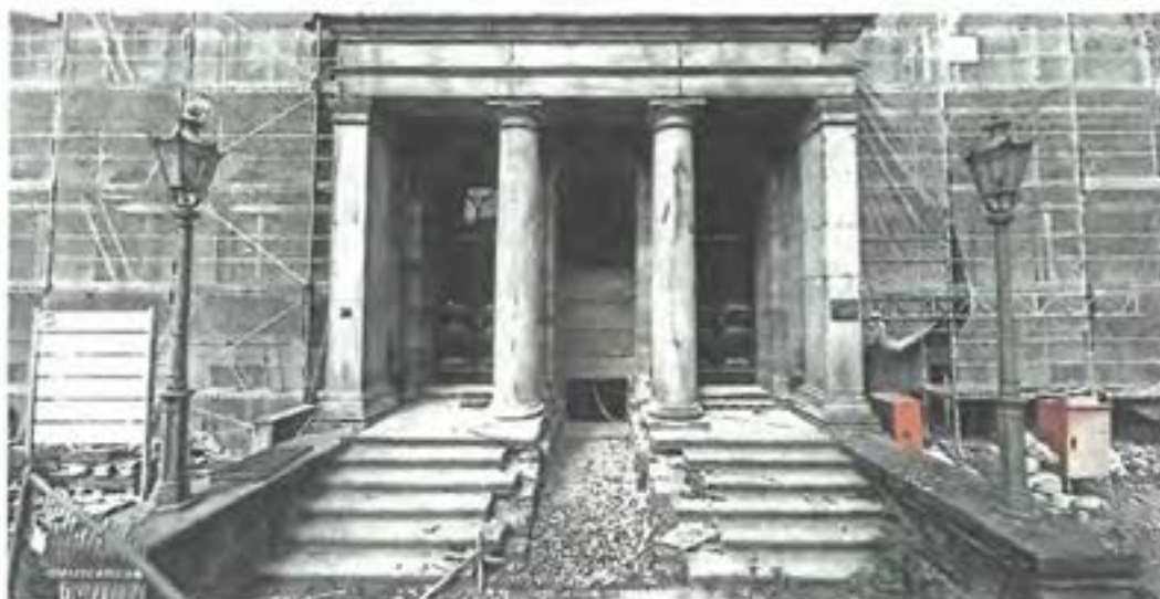
Die Arbeiten am „Forum Wissen“ der Universität Göttingen schreiten voran: Nicht allen gefällt das. Der Geschichtsverein Göttingen hat erneut die „Zerstörung“ des Eingangsportals des denkmalgeschützten Gebäudes kritisiert.