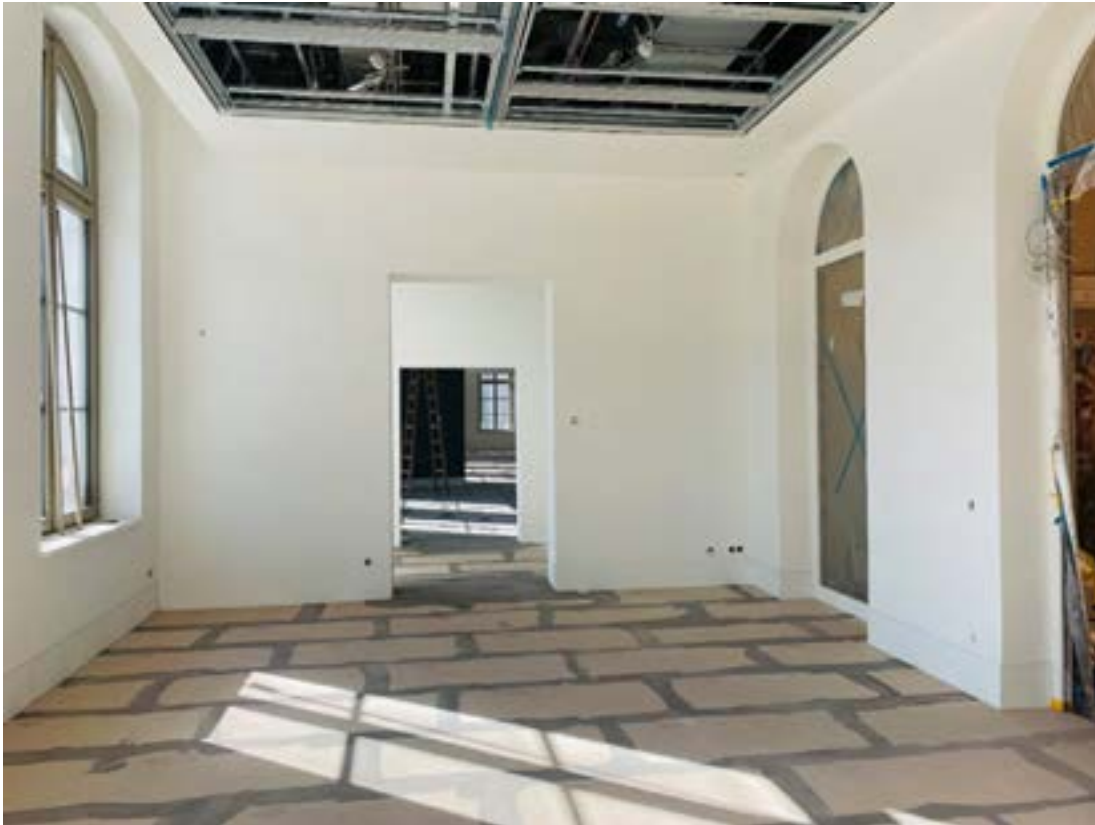
Exhibition spaces "Rooms of Knowledge"