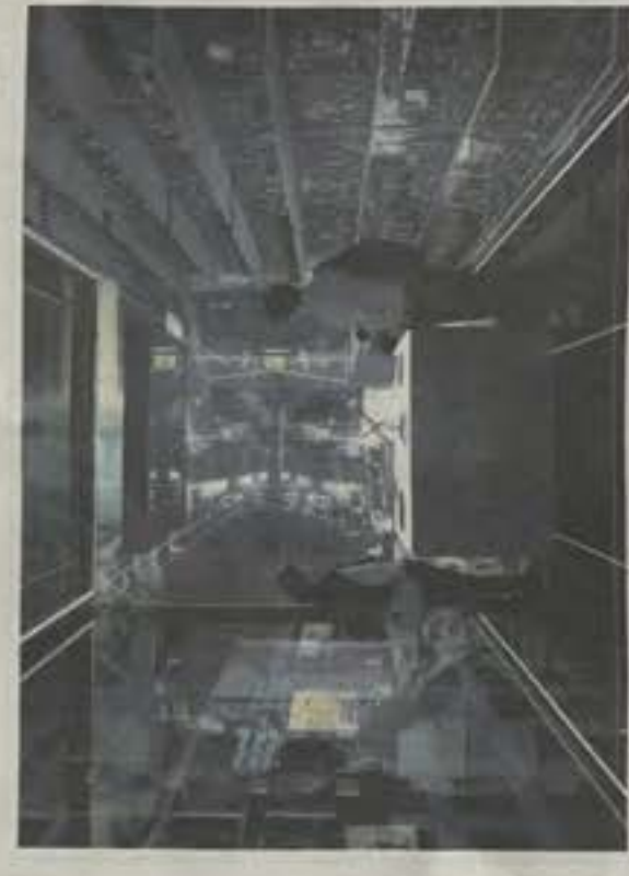
So könnte die Ausstellung aussehen.