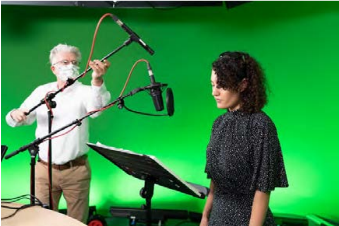
Audio recordings of the "Perspectives"