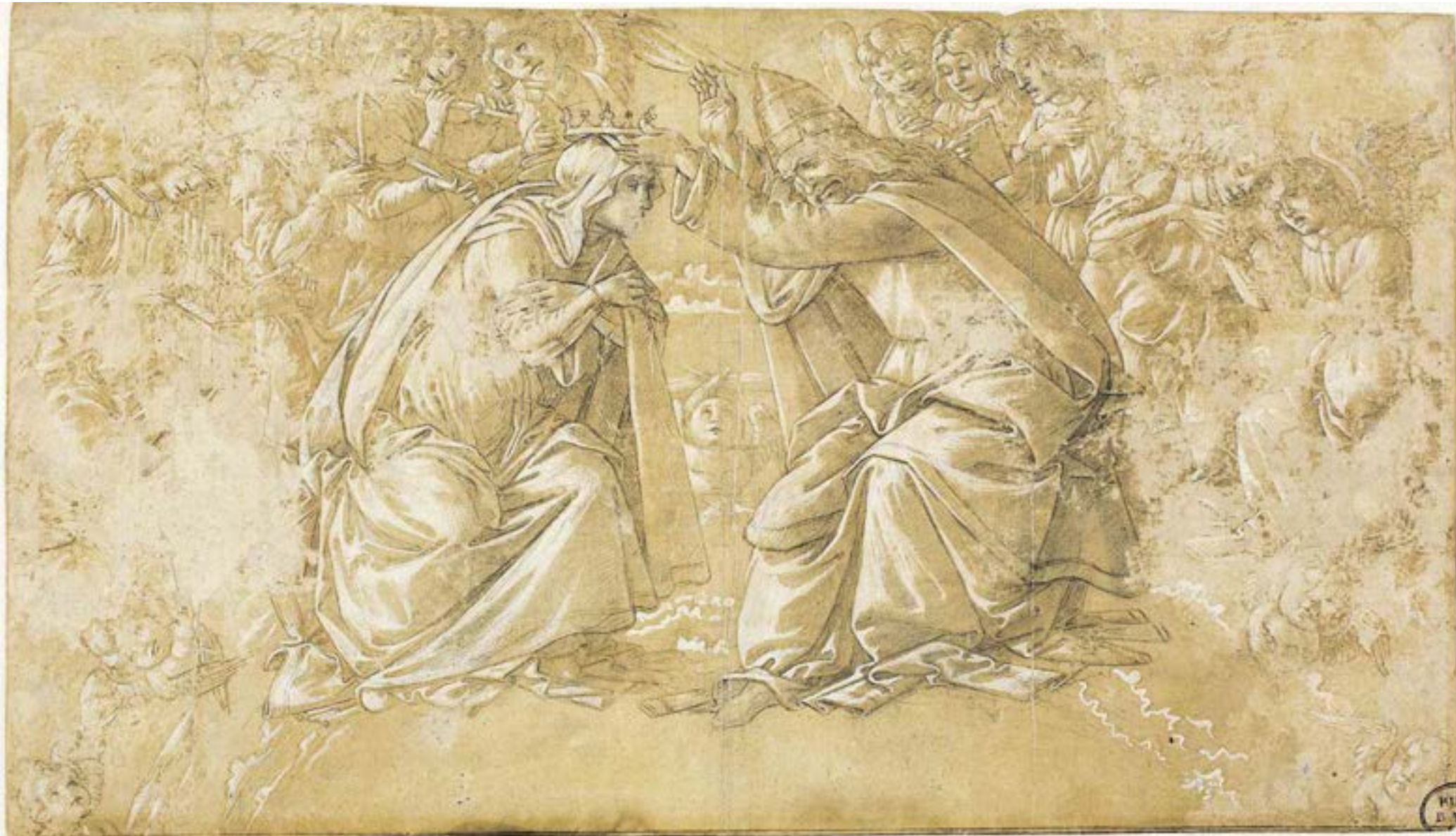
Kleinod aus der kunsthistorischen Sammlung: Sandro Botticellis Federzeichnung „Die Krönung Mariens“ (um 1488)

Das liegt nicht ganz auf der Linie des Resümeees, das Dozenten der Literaturwissenschaft auf einer Tagung gezogen haben (F.A.Z. vom 3. September). Hier wurde vor allem mit der Idealisierung der Präsenzlehre aufgeräumt. In der Tat gibt es an Seminaren mit sechzig Teilnehmern wenig zu beschönigen. Und manchmal ist der zielgerichtete Online-Kontakt effizienter. Nur: Er verlangt Dozenten eine Dauerbeschäftigung ab, die sie langfristig gar nicht leisten können. Das Problem liegt an anderer Stelle: der Vermassung der Universitäten und dem schlechten Betreuungsschlüssel. Das lässt sich aber nicht mit digitalen Tools oder dem neuerdings beworbenen Mix aus On- und Offline-Lehre, sondern nur mit einer besseren Personalpolitik lösen.