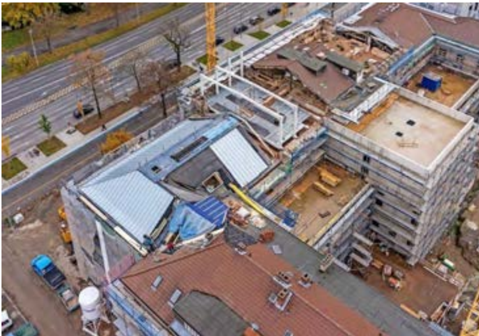
Großbaustelle: Das künftige „Forum Wissen“ mit dem „Kultur-Forum“ aus der Vogelperspektive.

Die Gesamtkosten für die Sanierung des denkmalgeschützten Kernbaus und die Ausstellung des „Forums Wissen“ liegen laut Planungen der Universität bei etwa 40 Millionen Euro, wie aus einem dem Tageblatt vorliegenden Papier hervorgeht. Die Universität trage davon demnach fast zwei Drittel; 16 Millionen Euro stammen den Angaben zufolge aus Fördermitteln, Sponsoring und Spenden.