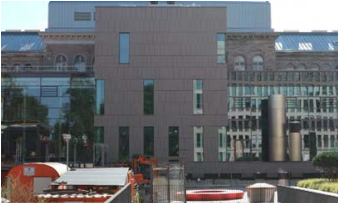
New buildings on the west side