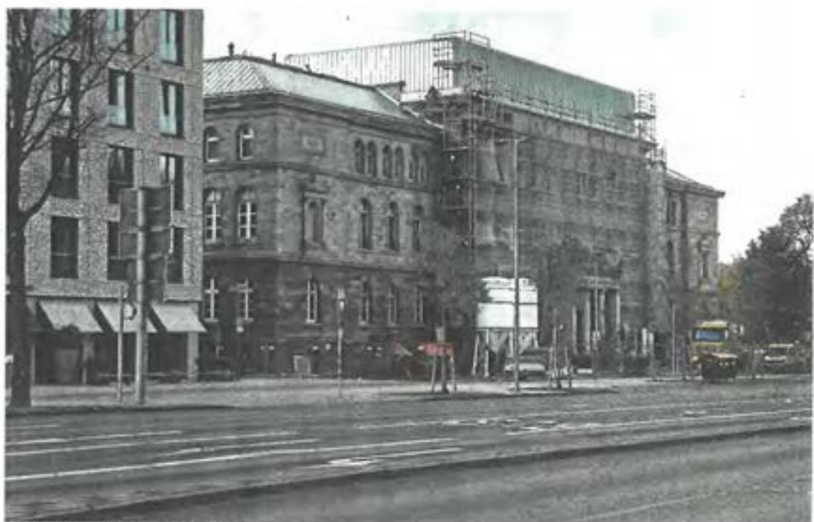
Baustelle „Forum Wissen“ an der Berliner Straße.

„Im Bücherturm geht es um das Innere der Bücher“, so Fürst. Auch wie die Staats- und Universitätsbibliothek Göttingen (SUB) mit Büchern umgeht, wird dort aufgegriffen.