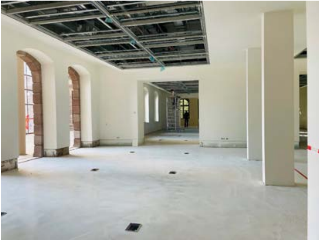
Exhibition spaces "Rooms of Knowledge"