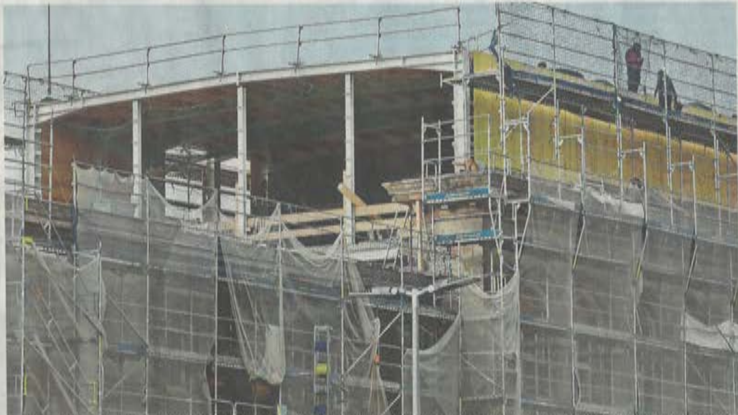
Das Forum Wissen der Universität Göttingen ist nach wie vor eine Baustelle. Aus einer Kooperation mit dem Städtischen Museum wird nun nichts werden.

Schon zu Zeiten der Uni-Präsidentin Ulrike Beisiegel habe es Gespräche gegeben, ob eine gemeinsame Nutzung von Uni und Stadt möglich sei in der Form, dass das Museum einen Platz im Forum Wis-