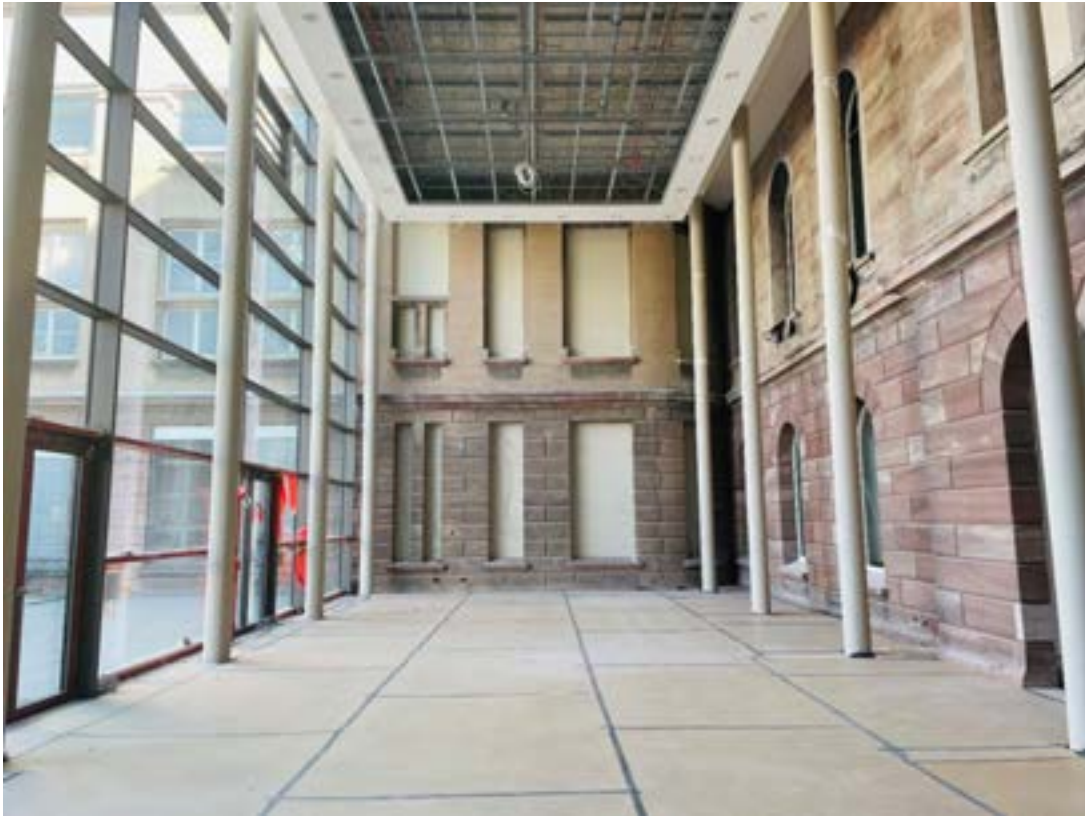
Ground floor atrium