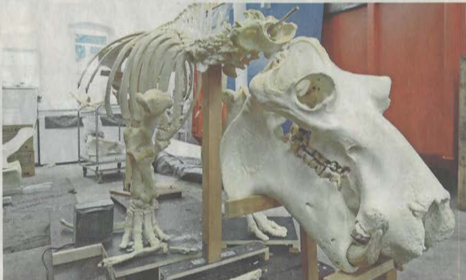
Das Nilgaur wird gerade für die Ausstellung präpariert.

„Die Biodiversitäts-Ausstellung soll in sechs Kapitel unterteilt unter-