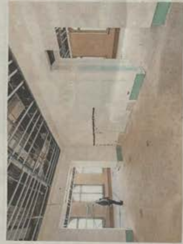
Im ersten Stock sollen Räume des Wissens eingerichtet werden.

insgesamt 715 Millionen Euro zu unterstützen. In dem Gebäude wird in den ersten beiden Etagen, zunächst das Forum Wissen im Frühjahr 2022 eröffnet. Zu dem Komplex gehört auch das künftige Biodiversitätsmuseum, das in der dritten Etage und einem Präparator, bereit.