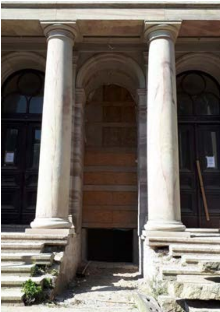
Opening of the barrier-free entrance in the main portal

The device on which the translated exhibition texts are displayed in the required language (sign language, accessible language, and in the future also other foreign languages) is an essential component of the Digital Layer in the FORUM WISSEN.