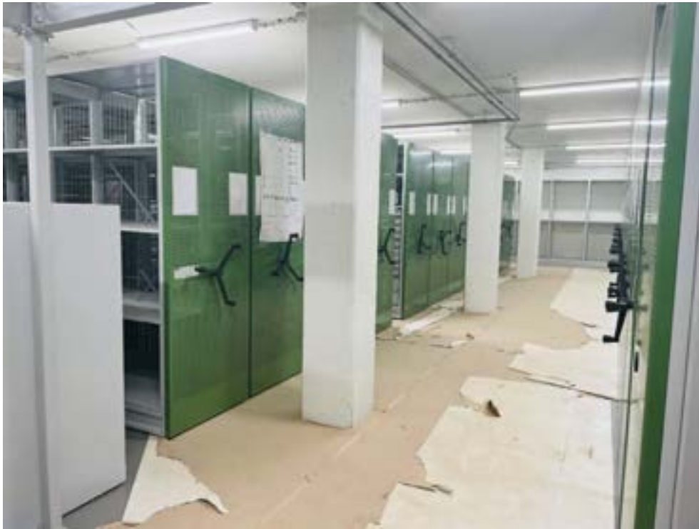
Depots in the basement