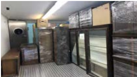
Nitrogen chamber treatment in Hanover